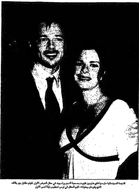
الزوجة المستقبلة لمراسم على مايرين طوبت بسمحة نجم برابيد في حفل العرس الأول لعميل قبطي وبلاك...